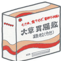
大草胃腸散 第3類医薬品

胃酸減少による「消化不良や栄養素の吸収障害、殺菌力の低下や感染症への抵抗力の低下」を招くことも。抑えることだけに頼らず、本来の正常な機能を回復させ、防御力を維持することも大切なのではないのでしょうか・・・。