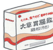
大草胃腸散 第3類医薬品