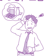
飲み過ぎ, 食べ過ぎ